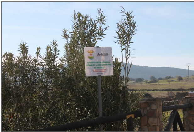
Barandilla del puente de Portugal(Alamillo)

Estas actuaciones, así como el equipamiento deportivo proporcionado al equipo de fútbol de la localidad tienen como objetivo apoyar el desarrollo económico-social de Alamillo y de sus habitantes.