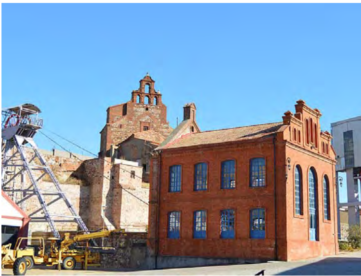
Parque Minero de Almadén

Por el parque han pasado casi 8.000 personas, el segundo mejor dato desde la inauguración en el curso 2008-2009